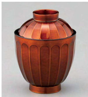
⑥ W-20-58 TA 花筐箸洗椀 白檀