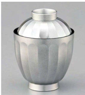
⑦ W-20-59 TA 花筐箸洗椀 銀透き