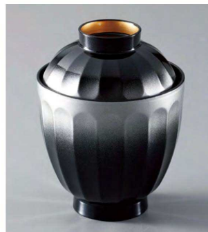
⑧ W-20-63 TA 花筐箸洗椀 銀ぼかし高台内金