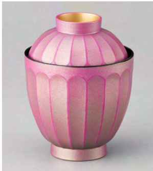
⑪ W-20-61 TA 花筐箸洗椀 銀紫蘭