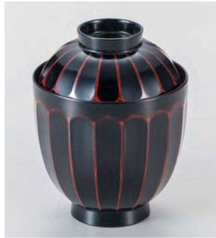
⑨ W-19-58D TA 花筐箸洗椀 曙