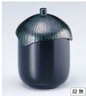
⑭ W-9-53 TM なす型小吸椀 黒