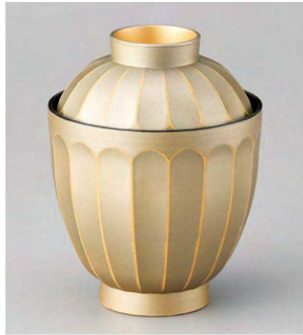
⑩ W-20-60 TA 花筐箸洗椀 銀緑蘭