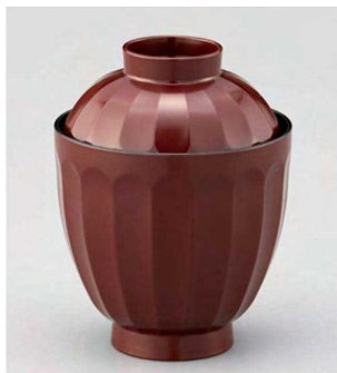
② W-20-57 TA 花筐箸洗椀 銀朱