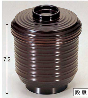
⑫ 1-155-1 TM ロクロ小吸椀 溜