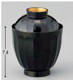
① W-20-56 TA 花筐箸洗椀 黒つば金