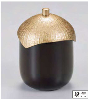
⑮ W-18-24 TM なす型小吸椀 溜/金