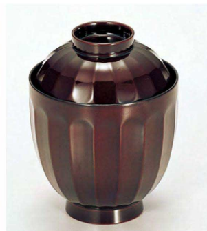
④ W-1-51D TA 花筐箸洗椀 溜