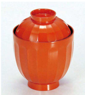
③ W-1-50B TA 花筐箸洗椀 朱内黒