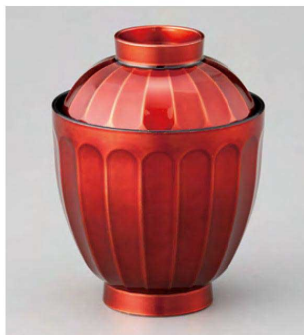
⑤ W-20-62 TA 花筐箸洗椀 ワイン透き