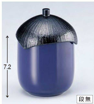
⑬ W-9-52 TM なす型小吸椀 紫