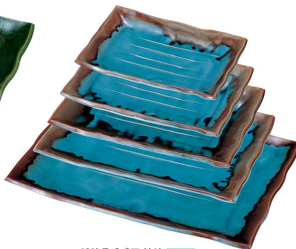
A 越前長手盛皿 清流 限定品