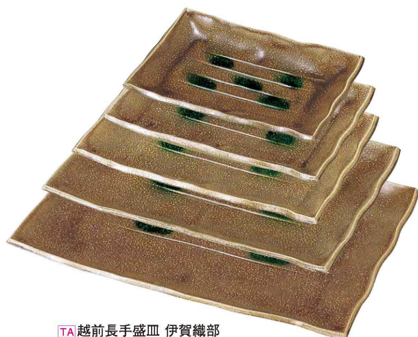
TA 越前長手盛皿 伊賀織部