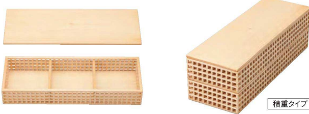
☎ 細目格子長角盛箱