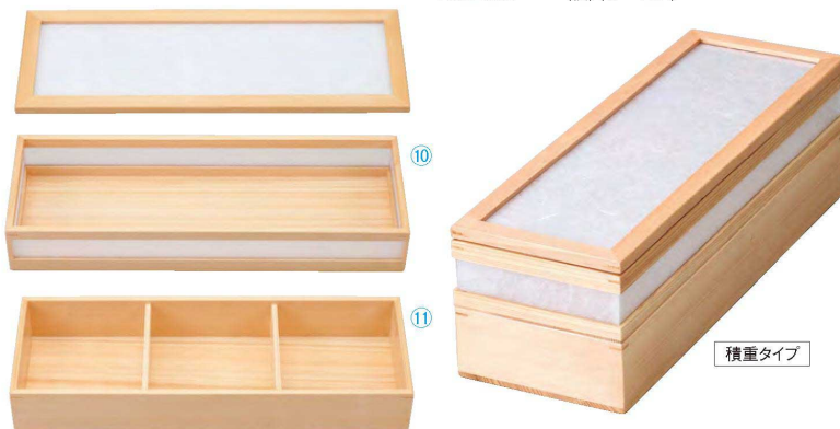
☎ 安土長角二段弁当(大)