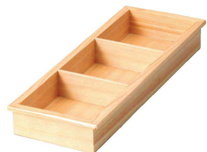
⑫ M-25-41 ☎ 桃山長手箱 三ツ切(固定仕切)