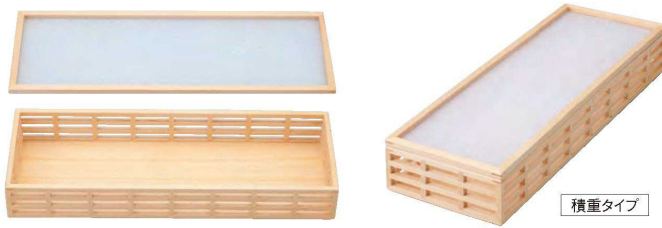
☎ 安土格子長角盛箱