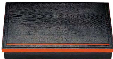
⑫ A 尺3寸長手松花堂 黒木目淵朱 朱ライン (仕切別) 1-273-1 ¥5,700 (38.3×26.5×6.5) 梱20