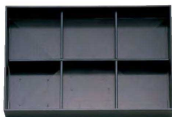
④ TA 尺3寸長手キング松花堂用A仕切 1-270-4 ¥980