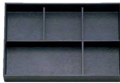
⑭ A 尺3寸長手松花堂用B仕切 1-262-5 ¥710