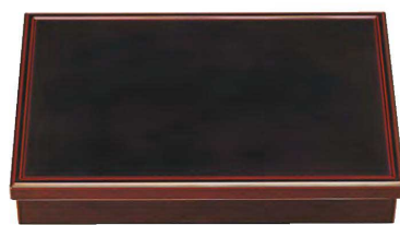
③ A 尺3寸淵高長手松花堂 外溜内黒 (仕切別) S-S造 1-270-3 ¥11,000 (38.1×25.8×6.3) 梱20