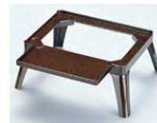
㉑ A 寿足 梨地 1-261-2 (尺3寸・尺7寸松花堂兼用) ¥6,500 (44×45×18) 梱20