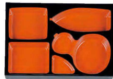
⑯ 1-264-7 TA 尺3寸千筋松花堂用D.X仕切 朱天黒 ¥2,400 (36×24.2×3.9) 梱40