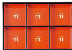
(6ヶ別々になります) ⑪ 1-358-4 TA 華角鉢 朱天黒1ヶ ¥1,200 (11.8×11.8×4.4) 梱150