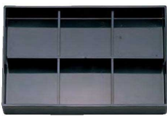
⑲ A 尺3寸ロイヤル松花堂用A仕切 1-275-3 ¥1,200