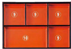
(5ヶ別々になります) ⑨ 1-358-4 TA 華角鉢 朱天黒1ヶ ¥1,200 (11.8×11.8×4.4) 梱150 ⑩ 1-334-8 TA 8.5寸松花堂用A仕切朱天黒 ¥1,250 (23.5×11.7×4) 梱100