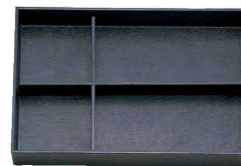
⑮ A 尺3寸長手松花堂用C仕切 1-267-3 ¥510