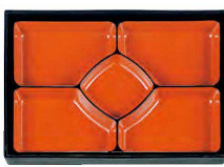
⑳ A 尺3寸ロイヤル松花堂用D.X仕切 朱天黒 1-275-6 ¥3,700 (36×23.8×4) 梱40