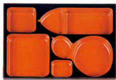
⑧ 1-272-6 TA 尺3寸長手松花堂用D.X舟仕切 朱天黒 ¥3,000 (35.2×23.5×4.2) 梱40