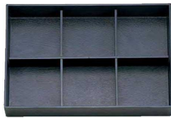
⑬ A 尺3寸長手松花堂用A仕切 1-262-4 ¥710