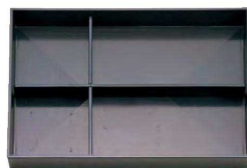
⑥ TA 尺3寸長手キング松花堂用C仕切 1-270-6 ¥680