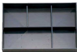
⑤ TA 尺3寸長手キング松花堂用B仕切 1-270-5 ¥950