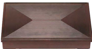
② TA 尺3寸長手キング松花堂 溜 (仕切別) 1-272-2 ¥6,400 (37.5×25.8×6.6) 梱20