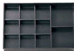
⑦ A 尺3寸長手松花堂用E仕切 C-1-78 ¥1,280