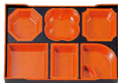
⑰ 1-247-9 TA 尺3寸長手松花堂用D.X懐石仕切 朱天黒 ¥2,800 (35.8×24.1×4) 梱40