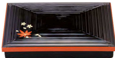
⑱ A 尺3寸ロイヤル松花堂 黒淵朱春秋 (仕切別) 1-275-1 ¥7,400 (38.7×26.4×6.3) 梱20