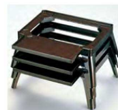
●寿足 どうし積み重ね出来ます。