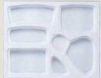
⑱ F-2-75A P.S.W-7 尺3寸長手 P.S.白仕切 (700入) ¥92,400 (1ヶ ¥132)