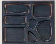
⑲ 1-451-12A P.S.W-7 尺3寸長手 P.S. 黒仕切 (700入) ¥92,400 (1ヶ ¥132)