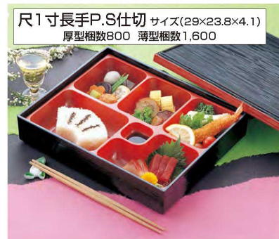
尺1寸長手P.S仕切 サイズ(29×23.8×4.1) 厚型梱数800 薄型梱数1,600