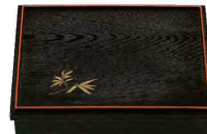
⑫ 1-367-1 A新尺1寸長手松花堂 黒天朱笹(仕切別) ¥3,900 (31.3×26×6.8) 梱20