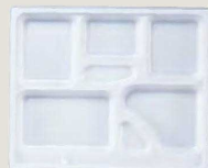
⑭ F-2-68A P.S.W-6 尺2寸長手 P.S.白仕切 (800入) ¥92,000 (1ヶ ¥115)