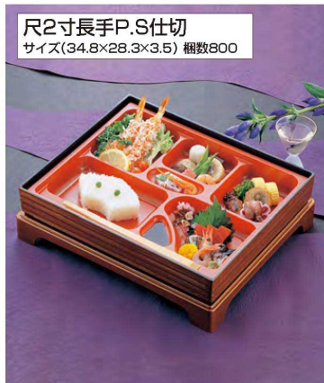
尺2寸長手P.S仕切 サイズ(34.8×28.3×3.5) 梱数800