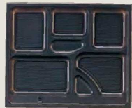
⑮ 1-451-9A P.S.W-6 尺2寸長手 P.S.黒仕切 (800入) ¥92,000 (1ヶ ¥115)