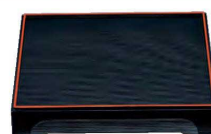
⑪ 1-241-6 A尺1寸長手御膳千筋松花堂 黒天朱(仕切別) ¥4,400 (31.3×26×7) 梱20