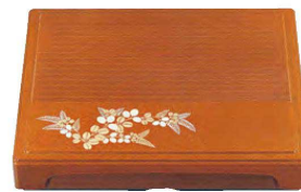
⑳ 1-346-2 A尺3寸千筋箱膳 梨地萩(仕切別) ¥7,400 (40×33×6.7) 梱10