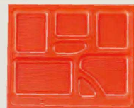
⑬ 1-451-8A P.S.W-6 尺2寸長手 P.S.朱仕切 (800入) ¥92,000 (1ヶ ¥115)