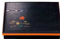
⑩ 1-240-6 A尺1寸長手木目松花堂 黒潤朱春秋(仕切別) ¥4,200 (31.5×26×7) 梱20