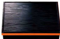
⑨ 1-240-5 A尺1寸長手ヘギ目松花堂 黒潤朱(仕切別) ¥3,400 (31.3×26×6.8) 梱20