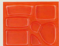
⑰ 1-451-11A P.S.W-7 尺3寸長手 P.S.朱仕切 (700入) ¥92,400 (1ヶ ¥132)