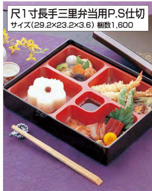
尺1寸長手三里弁当用P.S仕切 サイズ(29.2×23.2×3.6) 梱数1,600