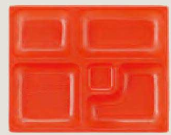
① 1-451-1A P.S.W-10 尺1寸長手三里弁当 P.S.朱仕切薄型 (1,600入) ¥113,600 (1ヶ ¥71)