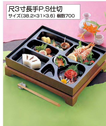
尺3寸長手P.S仕切 サイズ(38.2×31×3.6) 梱数700