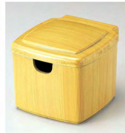
⑧ 1-511-3 TA 隅丸ガリ入れ 白木塗(切込有) ¥3,000(10×11.1×8.8) 梱80