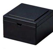
⑲ O-8-76 TA コンパクト角粉茶入れ 黒乾漆 ¥2,200(7.3×7.3×5)