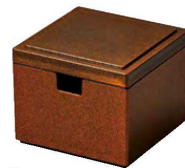
⑯ O-8-81 TA コンパクト角ガリ入れ 梨地 ¥2,200(9.2×9.2×7.5)