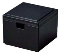
⑭ O-8-79 TA コンパクト角ガリ入れ 消し黒 ¥2,000(9.2×9.2×7.5)