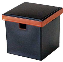
① O-1-93 TA (小)角ガリ入れ 黒刷朱(切込有) ¥2,800(11×11×10.9) 梱80