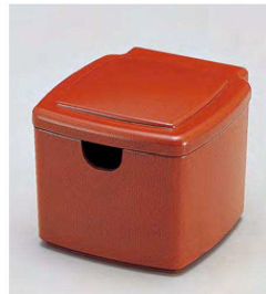
⑦ 1-511-2 TA 隅丸ガリ入れ 朱刷毛目(切込有) ¥2,900(10×11.1×8.8) 梱80