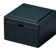
⑳ O-8-77 TA コンパクト角粉茶入れ グリーン乾漆 ¥2,200(7.3×7.3×5)