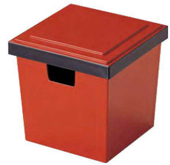
④ O-1-96 TA (大)角ガリ入れ 朱刷黒(切込有) ¥3,900(12×12×11.6) 梱90