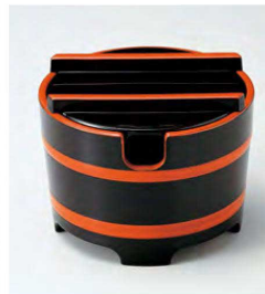
⑫ O-3-80 TA 桶型ガリ入れ 黒帯朱(切込有) ¥2,550(10.8φ×8.3) 梱80