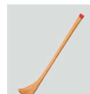
㉓ S-10-58 竹 小さじ ¥780(1×7.5)