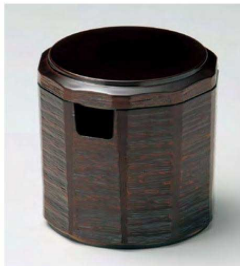
⑤ O-6-2 TA 木彫ガリ入れ 桧 ¥4,300(10.5φ×10.5) 梱100