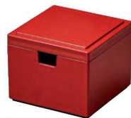
⑮ O-8-80 TA コンパクト角ガリ入れ 朱 ¥2,000(9.2×9.2×7.5)