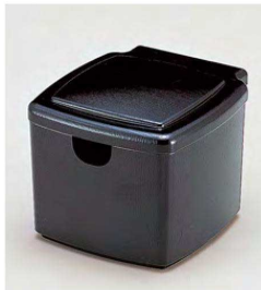
⑥ 1-511-1 TA 隅丸ガリ入れ 黒刷毛目(切込有) ¥2,900(10×11.1×8.8) 梱80