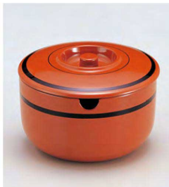
⑨ 1-511-8 TA ガリ入れ 朱に帯黒(切込有) ¥2,700(11.8φ×7.8) 梱80