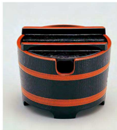
⑩ 1-511-6 TA 桶型ガリ入れ 黒木目天朱(切込有) ¥2,550(10.8φ×8.3) 梱80