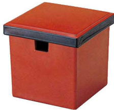
② O-1-95 TA (小)角ガリ入れ 朱刷黒(切込有) ¥2,800(11×11×10.9) 梱80