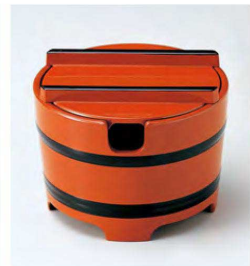
⑬ 1-511-7 TA 桶型ガリ入れ 朱帯黒(切込有) ¥2,550(10.8φ×8.3) 梱80