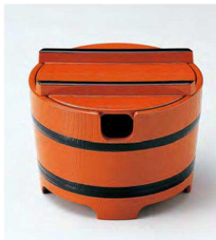
⑪ O-3-79 TA 桶型ガリ入れ 朱木目天黒(切込有) ¥2,550(10.8φ×8.3) 梱80