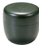
㉒ O-8-60 M 2.2寸ナツメ粉茶入れ グリーン乾漆 ¥1,900(6.5φ×6.5)