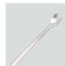
㉔ O-7-2 ステンレス(小)スプーン ¥350(8.6L)