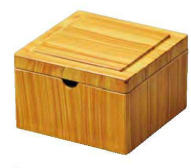
㉑ O-8-78 TA コンパクト角粉茶入れ 白木 ¥2,400(7.3×7.3×5)