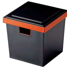
③ O-1-94 TA (大)角ガリ入れ 黒刷朱(切込有) ¥3,900(12×12×11.6) 梱90