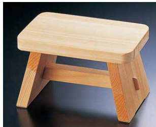
② 困風呂椅子 H-12-50 (小) ¥11,000 (25.5×16×16) 梱10