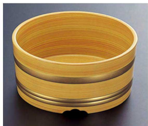
⑤ 1-832-4 A 風呂桶 白木塗金線 ¥3,000 (22.2φ×10) 梱10