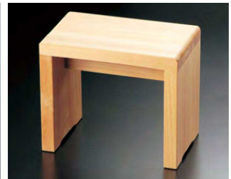
④ 困風呂椅子 コの字型 H-19-68 (小) ¥11,800 (30×18×25) 梱10 H-19-69 (大) ¥14,500 (30×20×30) 梱10