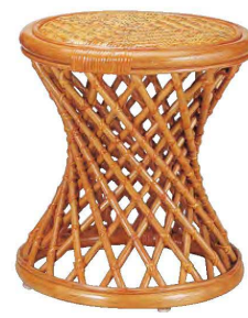
⑭ H-3-75 藤ラタンズツール 直送 ¥23,000 (38φ×41) 梱6

[直送] 商品はメーカーから直送の為、運賃は別途請求になります。 ※この頁の商品は、掛率が異なりますのでご注意ください。