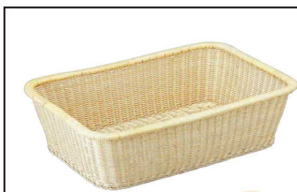
⑩ 1-837-4 藤脱衣かご C-20 直送 ¥12,300 (54×38×15) 梱20