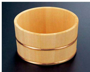
⑥ 1-832-11 困湯桶 ¥7,300 (23φ×11.5) 梱10