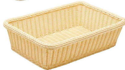
⑪ PP 樹脂脱衣かご ステンレス枠 直送 M-26-87 (小) ¥20,000 (50×38×15) 梱10 M-26-86 (大) ¥21,000 (55×38×15) 梱10