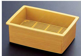
⑨ 1-832-6 A 石鹸入れ 白木塗 ¥1,500 (16.9×11.9×6.2) 梱60