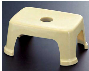
① P.P 風呂椅子 クリーム 1-832-1 ¥2,500 (31×22.2×13.5) 梱20