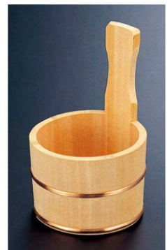
⑧ 1-832-10 困片手桶 ¥8,000 (15.5φ×24) 梱20