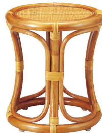
⑬ 1-836-13 藤丸椅子 直送 ¥18,500 (32φ×37) 梱6