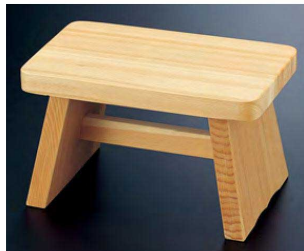
③ 困風呂椅子 1-832-7 (中) ¥12,000 (30×18×23) 梱10 1-832-8 (大) ¥13,500 (30×10×30) 梱10