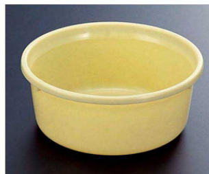
⑦ 1-832-3 A 風呂桶 クリーム ¥1,500 (25φ×10) 梱20