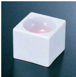
④ H-12-31 直送 陶 角丸珍味 白磁ピンク吹(有田焼) ¥2,300 (4.9×4.9×4.3)