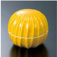
⑩ H-70-19 直送 陶 手まり型珍味 黄釉(有田焼) ¥2,300 (7.5φ×6.5)