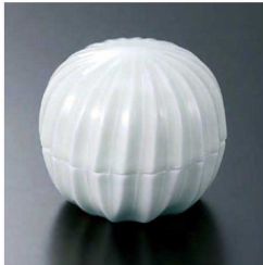
⑨ H-70-20 直送 陶 手まり型珍味 アイボリー(有田焼) ¥2,300 (7.5φ×6.5)