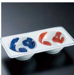
㉓ H-93-92 直送 陶 唐草濃丸二品盛(有田焼) ¥2,500 (14×7.6×2.6)