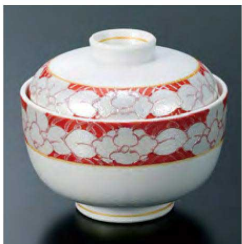
⑳ H-70-6 直送 陶 U型煮物碗(大) ロース赤ラスター(有田焼) ¥13,000 (11.8φ×10.2)