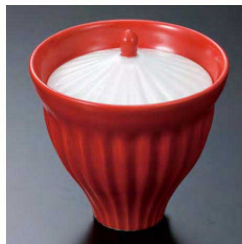
⑯ H-93-85 直送 陶 赤釉菊彫小吸椀(有田焼) ¥4,300 (9.5φ×10.3)