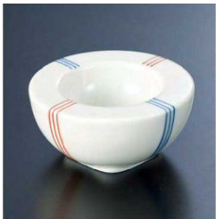
⑤ H-96-45 直送 陶 丸々小付 二色線(有田焼) ¥1,900 (7φ×3.5)