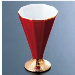
⑥ H-62-60 直送 陶 十角食前酒 赤釉高台金彩(有田焼) ¥2,600 (5.5×5.7×8.9)