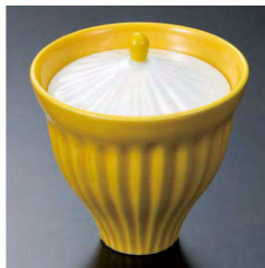
⑰ H-93-86 直送 陶 黄釉菊彫小吸椀(有田焼) ¥4,300 (9.5φ×10.3)