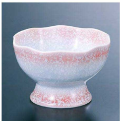
⑮ H-11-93 直送 陶 なぶり高台小鉢 ピンクたたき(有田焼) ¥3,500 (11.2φ×7.2)