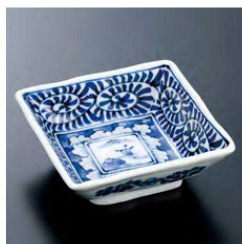
㉑ H-70-8 直送 陶 変形角皿(小) 山水唐草(有田焼) ¥1,500 (9.5×9.5×3.5)