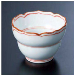
③ H-96-44 直送 陶 ひさご型小付 洲サビ見込筋(有田焼) ¥1,550 (6.7φ×5)