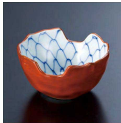
① H-96-43 直送 陶 箸置珍味 朱塗内アミ(有田焼) ¥2,400 (6.5φ×3.8)