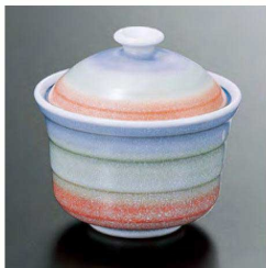
⑱ H-11-83 直送 陶 小蓋物 二色たたき(有田焼) ¥4,500 (9.4φ×9.2)