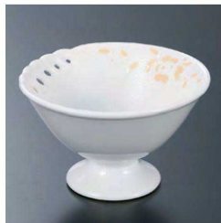
⑪ H-70-26 直送 陶 馬上中付 一珍ペーヅら透かし(有田焼) ¥8,200 (9φ×5.5)