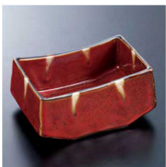
㉕ H-70-37 直送 陶 箱舟小鉢 南天赤流し(有田焼) ¥7,100 (13×9×5.5)

直送 この頁の商品はメーカーから直送の為、運賃は別途請求になります。*この頁の商品は、掛率が異なりますのでご注意ください。