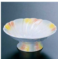
㉔ H-11-90 直送 陶 花淵高台小鉢 三色たたき(有田焼) ¥3,500 (14φ×5.4)