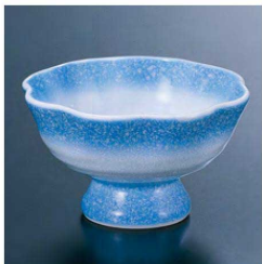
⑭ H-11-91 直送 陶 なぶり中付 ブルーたたき(有田焼) ¥3,200 (10.8φ×6.5)