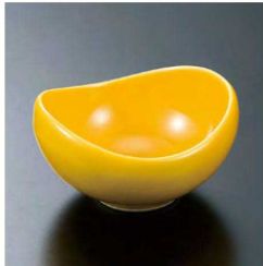
⑧ H-70-17 直送 陶 丸舟型小付 黄釉(有田焼) ¥4,450 (7×6.5×3.8)