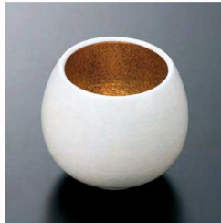
⑦ H-70-21 直送 陶 しずく小付 白M吹内金塗(有田焼) ¥3,950 (6.5φ×6)