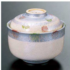
⑲ H-11-84 直送 陶 ゆず肌蓋物(小) 雲母銀彩(有田焼) ¥5,650 (10.6φ×9)