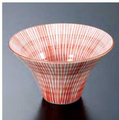
⑬ H-70-13 直送 陶 反鉢 内外刷毛十草(赤)(有田焼) ¥2,300 (12.1φ×7.1)