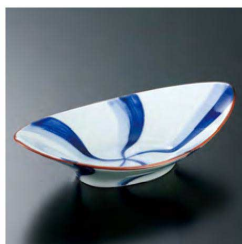
㉒ H-70-18 直送 陶 楕円一品盛 内外流水(有田焼) ¥1,700 (12.2×7.1×3.2)