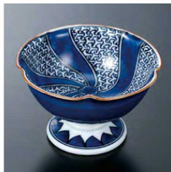
⑫ H-70-27 直送 陶 高台小付 Y地紋(有田焼) ¥7,200 (9.5φ×5.8) 限定品