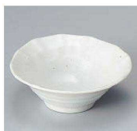
11432-470 白石垣ミニ鉢 680円 200入 (10×3.5cm)