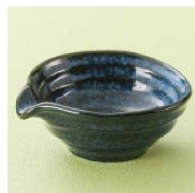
11431-570 コバルト六兵衛片口小鉢 650円 120入 (10×9.4×4.1cm)