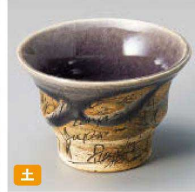
11413-510 紫釉刻紋反りミニカップ 2,400円 100入 (9.6×6.4cm)