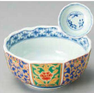
11421-130 錦唐草花花型小付 1,100円 (9.5×4.3cm)