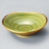
11415-730 四軸金(緑)小付(有田焼) 1,700円 5入 (10×3cm)