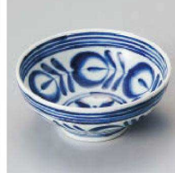
11419-730 モダンブルーボール(S)(有田焼) 900円 5入 (10×4cm・150cc)