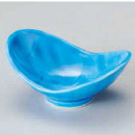
11403-180 トルコ青双葉小付 5,900円 80入 (12.2×8.3×5.3cm)