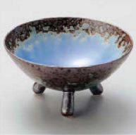
11409-730 南蛮クリ釉三つ足小付(有田焼) 3,000円 5×16入 (10.5×5cm)