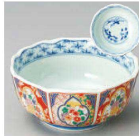
11424-130 錦木甲牡丹花型小付 1,100円 (9.5×4.3cm)