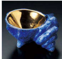
11401-290 さざえ(金ぬり)小付 12,300円 100入 (10.5×5.5cm) 11402-290 さざえ(金ぬり)珍珠 6,250円 150入 (7.5×4.3cm)