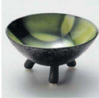
11411-730 うぐいす水玉三つ足小付(有田焼) 3,000円 5×16入 (10.5×5cm)