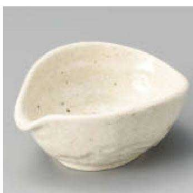
11429-100 白唐津新片口小鉢 770円 80入 (11.2×9×5cm)