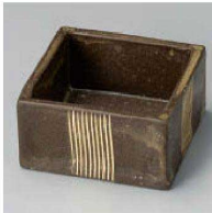
11405-130 灰釉一本樺目小鉢小 4,300円 (8×8×4cm)