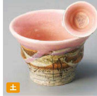
11412-510 ピンク釉刻紋反りミニカップ 2,400円 100入 (9.6×6.4cm)