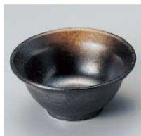
11426-020 金茶吹珍珠 750円 120入 (10×4.5cm)