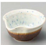
11435-100 岩清水片口小付 650円 120入 (11.2×9×5cm)