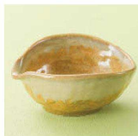
11430-450 金結晶新片口鉢 890円 100入 (11.2×8.9×4.7cm)