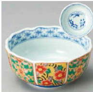
11423-130 錦流水花花型小付 1,100円 (9.5×4.3cm)