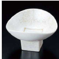
11406-140 ラスター精円高台小付 3,650円 60入 (10.5×9.8×6.4cm)