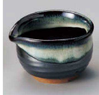
11414-240 天目白流し片口小鉢 1,600円 100入 (10×8.5×6.2cm・230cc)