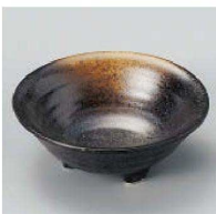
11428-020 金茶吹三つ足ミニ小鉢 750円 100入 (9.8×3.5cm)