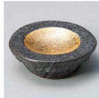
11407-460 金彩デザートボール 3,800円 48入 (12×4.1cm)