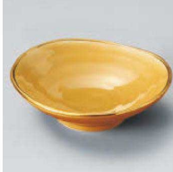
11417-730 四軸金(黄)小付(有田焼) 1,700円 5入 (10×3cm)