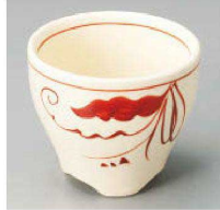
11408-470 朱髷絵高台小付 2,500円 100入 (7.6×4cm)