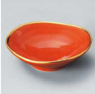
11416-730 四軸金(赤)小付(有田焼) 1,700円 5入 (10×3cm)