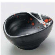
11434-230 潮うずうず小付 700円 120入 (10×8.5×4.5cm)