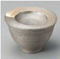
11404-660 黒窯突刷毛目4.0高台皿(信楽焼) 4,900円 50入 (12×8cm)