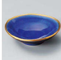
11418-730 青軸金小付(有田焼) 1,700円 5入 (10×3cm)