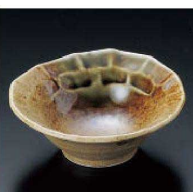
11433-450 伊賀織部面取小付 780円 120入 (9.7×3.6cm)