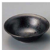
11437-400 いぶし反小付 570円 150入 (10.2×3.5cm)