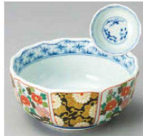
11420-130 錦菊牡丹花型小付 1,100円 (9.5×4.3cm)