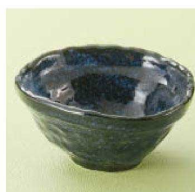
11436-570 コバルトなぶり三角小鉢 600円 80入 (11×5.2cm)