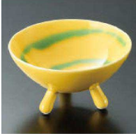
11410-730 黄釉グリーン渦三つ足小付(有田焼) 3,000円 5×16入 (10.5×5cm)