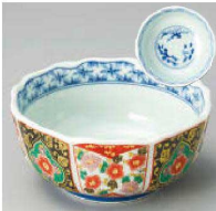
11422-130 錦唐草木甲花型小付 1,100円 (9.5×4.3cm)