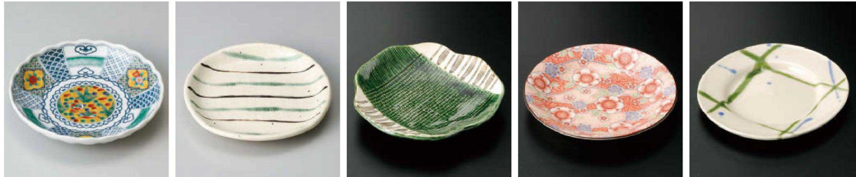
30021-100 丸谷花鳥5.0皿 1,250円 80入 (16.3×3.4cm) 30022-550 二色ストライプフルーツ皿 1,450円 60入 (16.2×2.5cm) 30023-100 織部十草4.8皿 1,150円 70入 (15.5×3cm) 30024-310 紅染ケーキ皿(赤) 1,380円 110入 (15.5×15.5×2.1cm) 30025-550 乱舞フルーツ皿 1,320円 80入 (15.4×14.5×1.6cm)