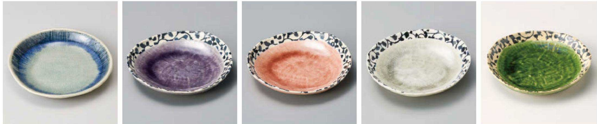
30011-570 御深井16cm前菜皿 1,500円 60入 (17×16.7×2.5cm) 30012-510 唐草ハイオレット銘々皿 1,350円 80入 (14×13.5×2.5cm) 30013-510 唐草ピンク銘々皿 1,350円 80入 (14×13.5×2.5cm) 30014-510 唐草グレー銘々皿 1,350円 80入 (14×13.5×2.5cm) 30015-570 唐草織部銘々皿 1,150円 142入 (14×13.5×2.5cm)