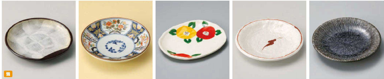
30001-570 備前志野半月5寸皿 1,400円 76入 (14.8×14.3×2.3cm) 30002-730 染錦紋様取皿(有田焼) 1,500円 10入 (14.5×3cm) 30003-570 赤絵椿 銘々皿 1,380円 80入 (14.8×12×1.8cm) 30004-020 唐辛子5.0皿 1,350円 90入 (16×2cm) 30005-440 星雲15cm丸皿 1,350円 100入 (15×2.2cm)