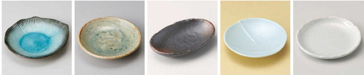
30016-100 藍染スカイ葉型5寸皿 1,200円 80入 (17.5×2.7cm) 30017-550 緑雲4.0丸皿 1,260円 80入 (13.2×2.7cm) 30018-020 備前風石目4.5小判皿 1,250円 100入 (14.2×9×2.5cm) 30019-290 青白磁ハスの取皿 1,250円 100入 (14.2×2.5cm) 30020-020 白4.5取皿 1,250円 80入 (14×1.6cm)