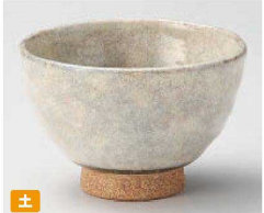
44419-510 ひすい煎茶 1,800円 100人 (10×6.5cm・250cc)