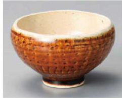
44407-510 鮎釉とびかんな波瀾煎茶 2,400円 60人 (10.5×6.5cm・200cc)