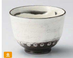
44417-440 三島大汲出し 1,750円 80人 (9.2×7cm・250cc)