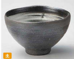
44418-510 黒陶煎茶 1,900円 80人 (9.5×6.3cm・220cc)