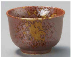
44429-360 南蛮千茶 740円 80人 (8.5×6cm・175cc)