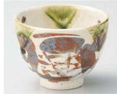
44406-510 織部おもだか紋煎茶 2,600円 80人 (9×7cm・220cc)