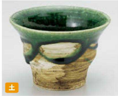
44408-510 今織部反カップ 2,400円 60人 (9.7×6.5cm・180cc)