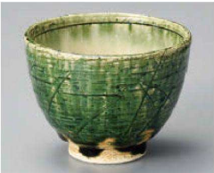
44405-510 総織部草彫煎茶 2,600円 50人 (9×7cm・220cc)