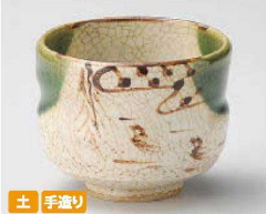
44415-510 織部ツバメ汲出し(手造り) 2,400円 80人 (8.5×6cm・230cc)