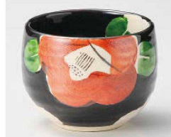
44411-570 色絵天目権玉煎茶 2,750円 105人 (8.3×6.5cm・230cc)