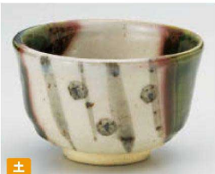
44425-020 蓼織部煎茶 1,280円 160人 (9×5.5cm・180cc)