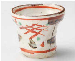
44403-510 赤彩鉄絵煎茶 3,600円 60人 (8.5×7.5cm・200cc)