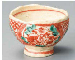
44401-510 赤彩丸紋手引き煎茶 5,500円 60人 (10×7.5cm・200cc)