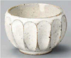
44410-510 粉引太削ぎ小煎茶 2,300円 100人 (7×5.3cm・110cc)