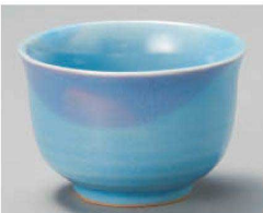
44430-360 ヒスイ貫入千茶 740円 80人 (8.5×6cm・175cc)