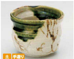
44424-510 織部花汲出し(手造り) 1,650円 100人 (7×6cm・130cc)