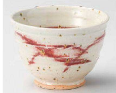
44412-660 赤絵汲出し(信楽焼) 2,150円 100人 (10×7.5cm・250cc)