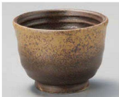
44428-360 金彩煎茶大 900円 80人 (8.5×6.5cm・230cc)