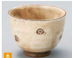
44422-440 新粉引印花大汲出し 1,750円 80人 (9.2×7cm・210cc)