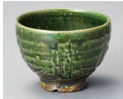
44402-510 総織部汲出 3,600円 80人 (10×7.5cm・280cc)