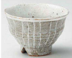
44413-510 唐津白盛十草切高台煎茶 2,400円 60人 (11×7.2cm・250cc)