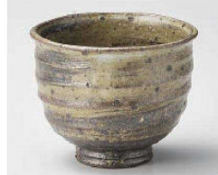
44416-660 灰釉刷毛目汲出し(信楽焼) 2,300円 120人 (9.5×8cm・260cc)