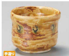
44427-510 黄瀬戸汲出し 1,650円 100人 (7×6cm・130cc)