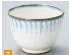
44421-440 窯変流十草汲出し大 1,750円 80人 (9.2×7cm・220cc)