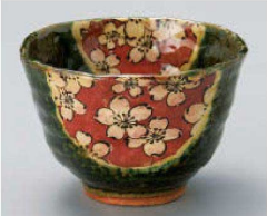
44420-580 織部舞桜煎茶 1,320円 100人 (9.5×6.5cm・220cc)