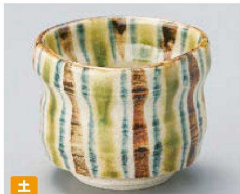
44423-510 麦わら手汲出し 1,650円 100人 (7×6cm・130cc)