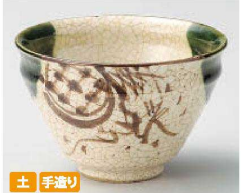
44414-510 織部つた天目煎茶 2,400円 120人 (9.8×6.5cm・240cc)