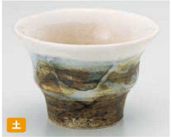
44409-510 水墨彩反カップ 2,400円 60人 (9.7×6.5cm・180cc)