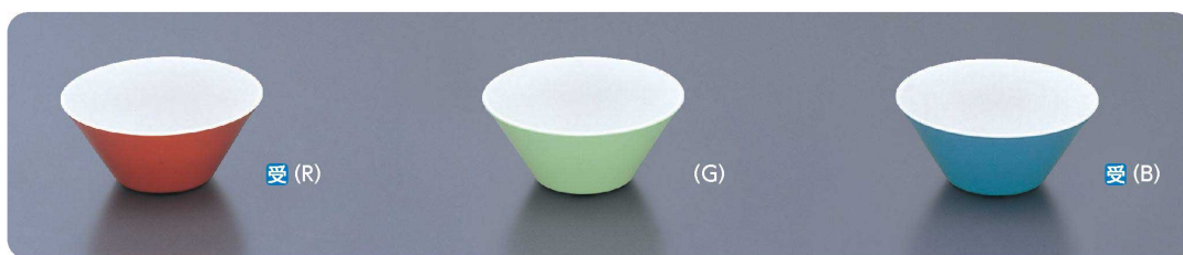
BD-10 ボール 144×63・500ml ¥680