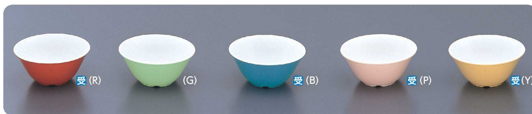
BD-22 ボール 125×57・350ml ¥600