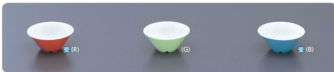
BD-16 ボール 121×52・300ml ¥600