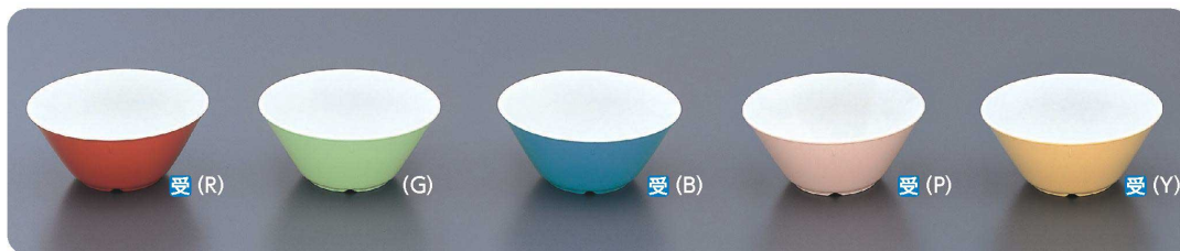
BD-15 ボール 135×60・435ml ¥670