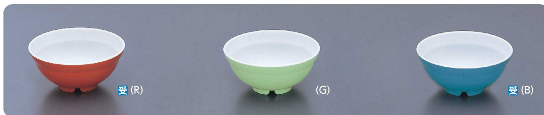
BD-1 飯丼 151×68・630ml ¥850