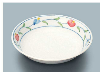
KS-846 AZ(あじわい) 深皿 162 × 33 ・ 310ml(10/80) ¥2,040 ☉ C-170 ¥540 → P.282 ☉ P-203 ¥510 → P.283