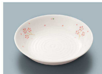
KS-846 RIO(里桜) 深皿 162 × 33 ・ 310ml(10/80) ¥1,800 ☉ C-170 ¥540 → P.282 ☉ P-203 ¥510 → P.283