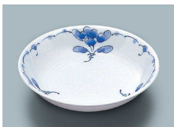
KS-846 SEI(青風) 深皿 162 × 33 ・ 310ml(10/80) ¥1,800 ☉ C-170 ¥540 → P.282 ☉ P-203 ¥510 → P.283