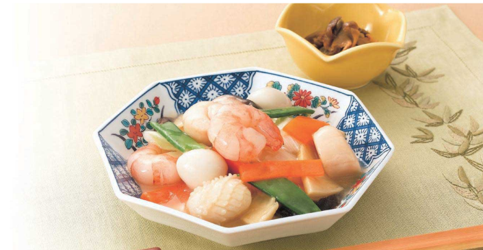
使用食器 | KS-857 AZ 八角皿、Z-1 AZY 丸小鉢