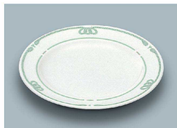
YS-3014 VL(ヴェールライン) パン皿 164 × 18 (6/72) ¥1,730 ☉ C-170 ¥540 → P.282