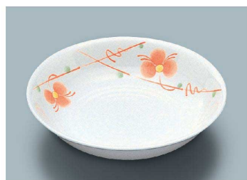
KS-846 HH(初花) 深皿 162 × 33 ・ 310ml(10/80) ¥1,800 ☉ C-170 ¥540 → P.282 ☉ P-203 ¥510 → P.283