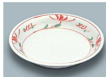
YS-5 AE(赤絵) 菜皿 168 × 28 (5/80) ¥1,530 ☉ C-170 ¥540 → P.282