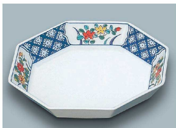
KS-857 AZ(あじわい) 八角皿 170 × 31 (10/60) ¥4,330