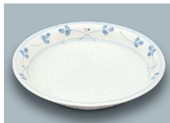
YS-5 HG(萩) 菜皿 168 × 28 (5/80) ¥1,500 ☉ C-170 ¥540 → P.282