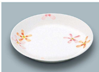
KS-862 AZ(あじわい) 浅皿 167 × 27 (10/100) ¥2,200 ☉ C-170 ¥540 → P.282