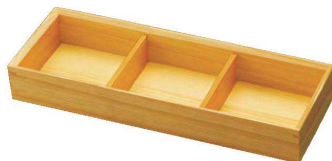
木和美・ミニ三ツ切弁当

21-154-05(27098) 身(三ツ仕切) ¥3,850 30.7×10.8×H4.8cm (1樹内寸9.4×9.4cm×H4.1cm/仕切H3.5cm) ※身(三ツ仕切)のみ ※蓋は付いておりません。 ※材料の特性上節や黒いスジが入ることがあります。