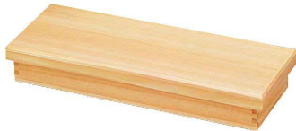
檜・ミニ長手松花堂(三ツ仕切)

21-154-01(27108) ¥9,900 32×12×H5.7cm/身外寸31×10.7×H4.7cm (1樹内寸9.4×9.4cm×H4cm/仕切H3.5cm)