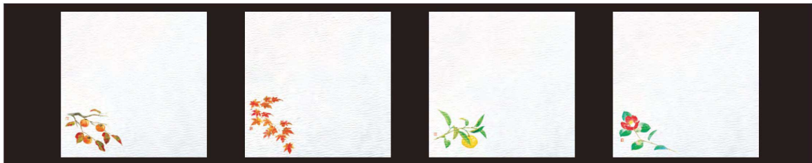
21-384-09(64777) 柿(9月~11月) 21-384-10(64754) 紅葉(10月~11月) 21-384-11(64778) 柚子(10月~12月) 21-384-12(64774) 椿(11月~2月)