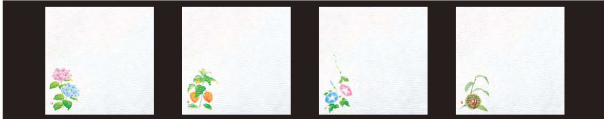
21-384-05(64775) 紫陽花(6月~7月) 21-384-06(65126) ほおずき(6月~8月) 21-384-07(64766) 朝顔(7月~8月) 21-384-08(64752) 栗(8月~10月)