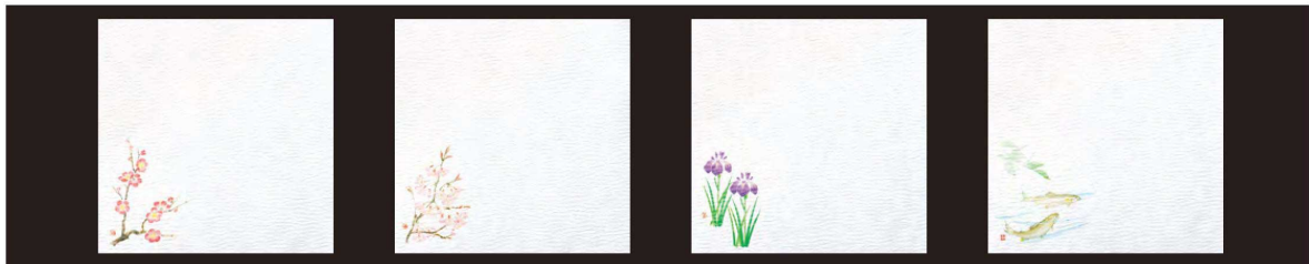
21-384-01(64764) 梅(1月~3月) 21-384-02(64750) 桜(3月~4月) 21-384-03(64765) 菖蒲(4月~5月) 21-384-04(65124) 鮎(4月~8月)