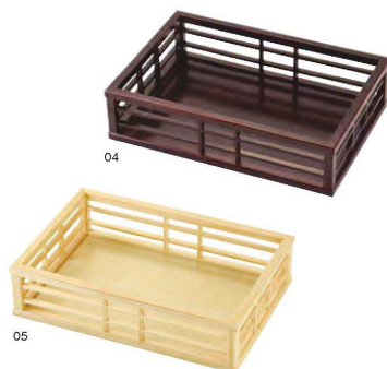
おもてなし格子料理箱

21-098-03 (27236) ¥7,200 16.2×11×H4.5cm/1樹内寸4.7×4.7×H4cm ※仕切高さH3/1.5cm ※身・仕切セット