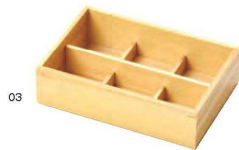
ひのき・おつまみ料理箱 (6仕切)