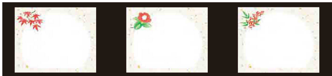
07 (66898) 赤もみじ(10月~11月)