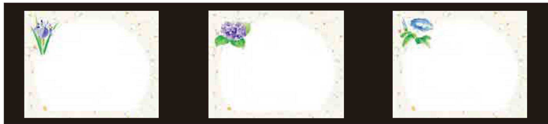
04 (66894) 菖蒲(4月~5月)