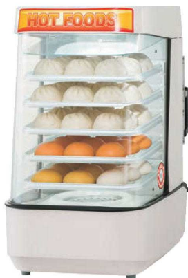
④スチームマスター MJ45B 74 直B

商品を早く効果的に蒸し上げ、蒸気が発生させながら保温しますので、中華まん等の店頭販売に最適です。