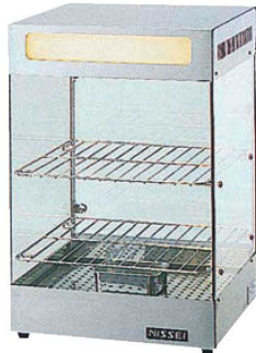
納期 直B ②ホットショーケース NH-550T 70 ページコード 商品コード 価格 6-1121-0201 2955400 ¥199,000