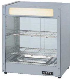
納期 直B ①ホットショーケース NH-205 72 ページコード 商品コード 価格 6-1121-0101 2955320 ¥147,000