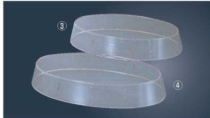
ポリカーボネイト 魚皿枠