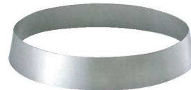
⑤SW 18-8 魚皿用 皿枠