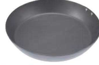
⑧ココパン プレミアム