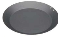
⑦ココパン モーニング