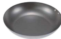
④ココパン ベーシック