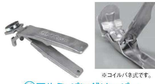
⑩アルミ パングリッパー (マグネット付)