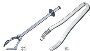
㉔ ヴォストフ アイストング 3566