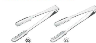
㉒ エコクリーン 18-8 ロール式厚口 棒型アイストング