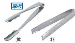
⑯ 18-0 棒型アイストング