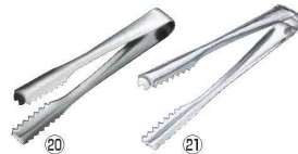
⑳ エコクリーン 18-0 棒型アイストング