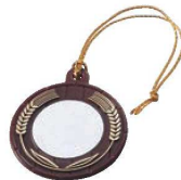
⑨ボトルネーム 樽型 (100枚セット)