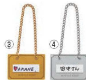
シンビ ボトルキーパー (10枚入り) BM-2