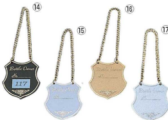
えいむ ボトルタグ NP-1 (20枚入)