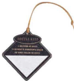
⑧T型ボトルネーム 角型 (100枚セット)