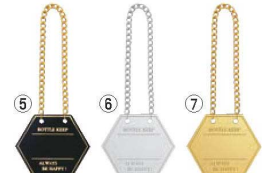
シンビ ボトルキーパー (10枚入り) BM-4