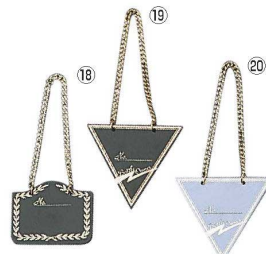
えいむ ボトルタグ (20枚入)