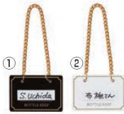
シンビ ボトルキーパー (10枚入り) BM-1