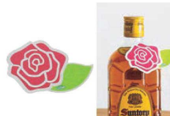
㉔)ボトルキーブシール パラ 11677 (200枚入)

55×H40 ボトルネームシール(10シート入) ※1シート10枚付 ※ボトルにそのまま貼ってお使いください。