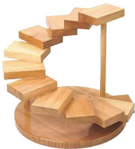
③螺旋 (十二段) 35396 加 画A ページコード 商品コード 価格 6-1614-0301 1537880 ¥39,600 外寸:φ395×H323 重量:2.5kg