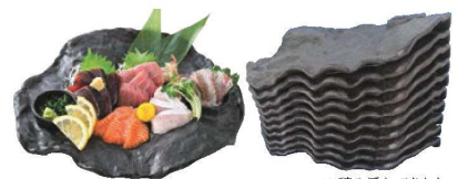
⑪月面プレート 黒砂 HO-358 洗 ページコード 商品コード 価格 6-1614-1101 0772800 ¥8,000 外寸:340×290×H46 材質:磁器 ●寿司盛や肉皿に最適! ●積み重ねがで場所をとりません