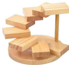
④螺旋 (八段) 35397 加 画A ページコード 商品コード 価格 6-1614-0401 1537890 ¥29,700 外寸:φ307×H227 重量:1.5kg