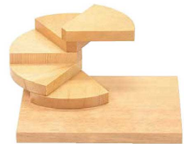
⑥回旋・角ベース (五段) 35399 加 画A ページコード 商品コード 価格 6-1614-0601 1537910 ¥25,300 外寸:330×335×H135 重量:1.47kg