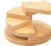
⑤回旋・丸ベース (六段) 35398 加 画A ページコード 商品コード 価格 6-1614-0501 1537900 ¥24,200 外寸:φ260×H160 重量:1.38kg