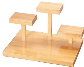
②遊山 (三山) 32361 加 画A ページコード 商品コード 価格 6-1614-0201 1537870 ¥17,600 外寸:360×265×H198 重量:1.7kg