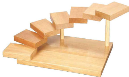
①段々 (七段) 32360 加 画A ページコード 商品コード 価格 6-1614-0101 1537860 ¥27,500 外寸:460×320×H198 重量:2.3kg