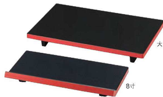
⑦DX盛台 黒淵朱 ページコード 外寸 商品コード 価格 8寸 6-1614-0701 230×122×H30 7596500 ¥2,750 小 6-1614-0702 273×121×H33 7598000 ¥3,000 大 6-1614-0703 273×167×H37 7597900 ¥3,200 材質:ABS樹脂