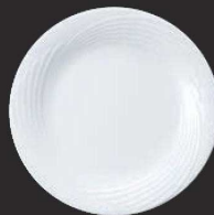
③ 25cmプレート BA200-200 洗 ページコード 商品コード 価格 6-1641-0301 7538020 ¥1,800 D253mm H22mm