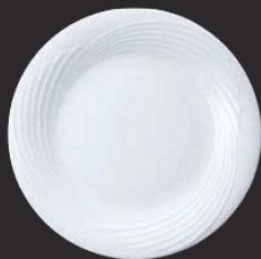
① 31cmプレート BA200-313 洗 ページコード 商品コード 価格 6-1641-0101 7538000 ¥4,080 D306mm H27mm