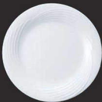
② 27cmプレート BA200-201 洗 ページコード 商品コード 価格 6-1641-0201 7538010 ¥2,040 D272mm H24mm