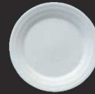
②ミート皿 24cm 40610-5337 ナ ページコード 商品コード 価格 6-1649-0201 1583200 ¥1,600 φ242×H22