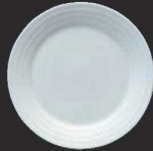
①ディナー皿 27cm 40610-5336 ナ ページコード 商品コード 価格 6-1649-0101 1583000 ¥1,900 φ274×H31