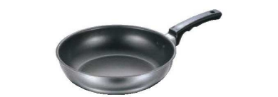
②フジ IH いため鍋 DX

材質:ハンドル/18-8ステンレス 内面フッ素Wコート ●作業性を考えた、短めのもちよいハンドルです。