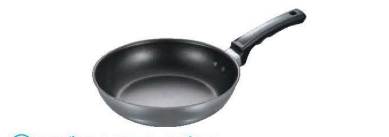
③フジ IH フライパン (いため鍋) DX