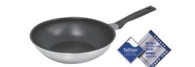
⑤IHルミエール いため鍋

材質:本体/アルミニウム合金 底面/ステンレス鋼 ハンドル/フェノール樹脂 内面フッ素樹脂塗膜加工 外面焼付塗装 ●耐摩耗性試験100万回クリア ●ダイキャスト製法で軽くて熱効率が高く丈夫です。 ●リベット(ハンドル留め具)がないので汚れがたまりにくく洗いです。