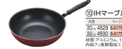
⑩IHマーブル 大きないため鍋

材質:アルミニウム合金、ステンレス板SUS430、フェノール樹脂 表面フッ素加工 ●独自の圧縮フッ素コートで汚れも落ちやすく金属ヘラもOK!