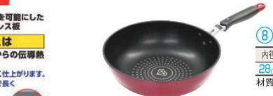
⑧IHアートワ いため鍋

材質:アルミニウム合金、ステンレス鋼、フェノール樹脂 内面フッ素加工 ●外面は集け付着しにくく、汚れも簡単に落ちます。 ●食材をお皿に盛り付けやすい、なめらかなフチ形状です。