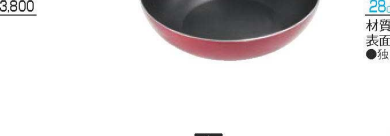
⑨グッドフル IH いため鍋

材質:本体/アルミニウム合金 底面/ステンレス鋼 ハンドル/フェノール樹脂 内面ダイヤモンドコート 外面焼付塗装 ●耐久性抜群でキズがつきにくい(金属ヘラ使用可能)