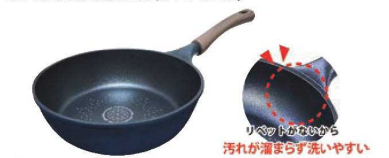
④IHマリウスダイヤモンド いため鍋