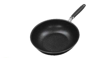
⑥IHダイヤモンドマーブルDX いため鍋

材質:本体/18-0ステンレス ハンドル/フェノール樹脂 内面アルミニウム合金、テフロンプラチナ加工