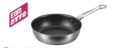
①EBM ビストロ 二層クラッド (アルミ/ステン) いため鍋