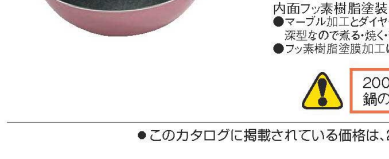
⑪アドレ IH対応 深型フライパン

材質:アルミニウム、18-0ステンレス ハンドル/フェノール樹脂 内面フッ素樹脂加工