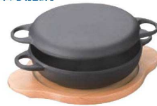
⑩鉄 ニューラウンド万能鍋 (木台付)