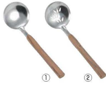
EBM ウォールナット柄 卓上お玉