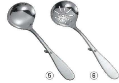
18-8 共柄 卓上お玉 フック付