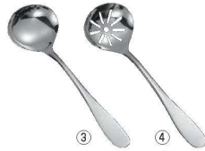
18-8 共柄 卓上お玉 フックなし