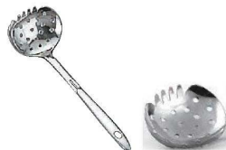
⑧18-8 食卓工房 お玉 穴明 中

60×55×全長195 ●鍍目のない一枚仕上げ(フック付) ●鍍や土鍋、ドンブリのフチに立てかけられて、鍋の中にずりおちない形状