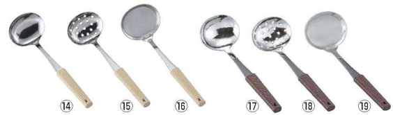
18-8 味道楽 アイボリー