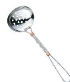
⑨18-8 銅線巻 お玉 穴明 大