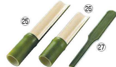
つみれ入れ越前若竹 (全面塗)