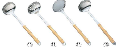
⑩18-8 夕華 お玉穴無