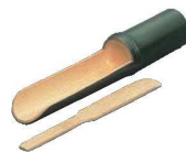
㉑ツミレ皿 ヘラ付 柄付 中新若竹