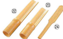
つみれ入れ越前ゴマ竹 (全面塗)