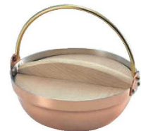
⑭銅 段付ツル付鍋(木蓋付) 1人用