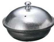
⑤しぐれ鍋 小丸 蓋付