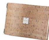
③ナチュラル (A4横) ㊴