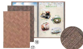
シンビ メニューブック LS-707 閉

230×315(A4 4ページ仕様) 材質:PVCレザー 対応パーツ: 抗菌ビニール-55 (5枚入) 6-1935-1602 7839122 ¥1,900