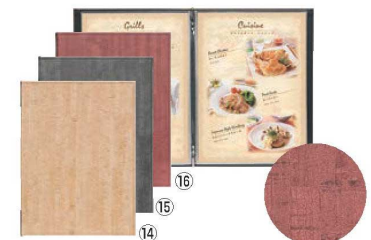
シンビ コルク調メニューブック CORK-301 閉

275×382(B4 4ページ仕様) 材質:ビニールペーパー 対応パーツ: ビニール-68 (10枚入) 6-1935-1302 7839181 ¥4,000