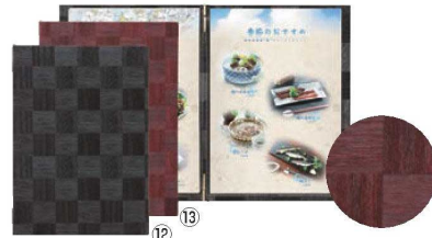
シンビ メニューブック LS-115 閉

278×205(B5ヨコ 4ページ仕様) 材質:ビニールペーパー 対応パーツ: ビニール-65 (10枚入) 6-1935-1102 7839151 ¥3,000