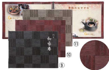
シンビ メニューブック LS-113 閉