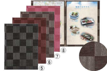
シンビ メニューブック LS-112 閉

230×315(A4 4ページ仕様) 材質:ビニールペーパー 対応パーツ: 抗菌ビニール-55 (5枚入) 6-1935-0402 7839122 ¥1,900