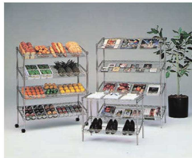
オプションパーツはP2146~2148をご覧ください。

材質:棚板/スチールワイヤー、クロームメッキ 抗菌クリアコーティング仕上 ポール/18-8ステンレス製