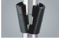
①テーパー (2ヶ1組) 74