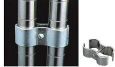
②ポストクランプ POK 74