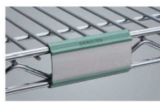
④ピンマーカー 9989P 74