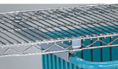
⑧トートボックスレール TBレール 74

材質: SUS304ステンレス ●カートのハンドルとして、また縦サイドの物掛けとしても便利です。