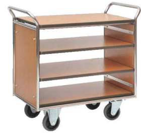
⑦レストランズワゴン SA-42E 74

ページコード 商品コード 価格 6-2240-0501 5413410 ¥212,000 6-2240-0601 5413500 ¥234,000 ⑤E10F 白 ⑥S10F 木目 外寸:750×500×H996 キャスター:φ100(自在×2 固定×2) 材質:フレーム/ステンレスパイプ 棚板/合板アコラ張り 棚間隔:上段192 中段193 下段193 ※耐荷重:45kg