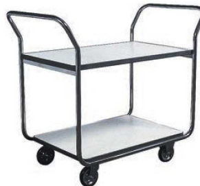
⑨レストランズワゴンエコノミー SA-32E 74

ページコード 商品コード 価格 6-2240-0801 1248400 ¥176,000 外寸:900×500×H720 キャスター:φ100(自在×4) 材質:フレーム/ステンレス丸パイプ仕上 棚板/アイボリー仕様アコラ張り(ゴムエッジ付) 棚間隔:上段250 下段227 ※耐荷重:45kg