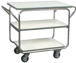
①レストランズワゴン SA-33E 74

ページコード 商品コード 価格 6-2240-0101 1248700 ¥143,000 外寸:925×510×H710 キャスター:φ100(自在×2 固定×2) 材質:フレーム/ステンレスパイプミラー仕上 棚板/メラミン化粧板アコラ張り 棚間隔:上段239 下段240 ※耐荷重:45kg