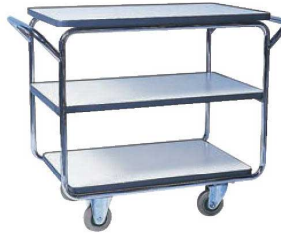
②レストランズワゴン SA-35E 74

ページコード 商品コード 価格 6-2240-0101 1248700 ¥143,000 外寸:925×510×H710 キャスター:φ100(自在×2 固定×2) 材質:フレーム/ステンレスパイプミラー仕上 棚板/メラミン化粧板アコラ張り 棚間隔:上段239 下段240 ※耐荷重:45kg