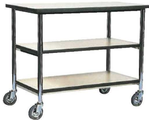
⑧レストランズワゴン SA-81E 74

ページコード 商品コード 価格 6-2240-0701 0494900 ¥231,000 外寸:900×450×H850 キャスター:φ125(自在×2 固定×2) 材質:フレーム/ステンレス 棚板/メラミン化粧板仕上 棚間隔:上段160 中段162 下段165 ※耐荷重:50kg