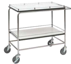
⑩ナチュラルワゴン SA-11E 74

ページコード 商品コード 価格 6-2240-0901 0504710 ¥145,000 外寸:875×510×H785 キャスター:ゴム製φ100(自在×2 固定×2) 材質:フレーム/ステンレスパイプ 棚板/メラミン化粧板 棚間隔:430 ※耐荷重:30kg