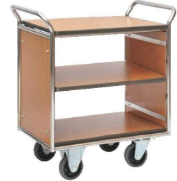
③レストランズワゴン SA-41E 74

ページコード 商品コード 価格 6-2240-0201 1248710 ¥200,000 外寸:1,045×510×H770 キャスター:ゴム製φ125(自在×2 固定×2) 材質:フレーム/ステンレス 棚板/メラミン化粧板 棚間隔:上段270 下段270 ※耐荷重:45kg