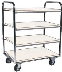
④レストランズワゴン SA-33FE 74

ページコード 商品コード 価格 6-2240-0301 5413300 ¥225,000 外寸:750×450×H850 キャスター:φ125(自在×2 固定×2) 材質:フレーム/ステンレス 棚板/メラミン化粧板仕上 棚間隔:上段265 下段265 ※耐荷重:45kg