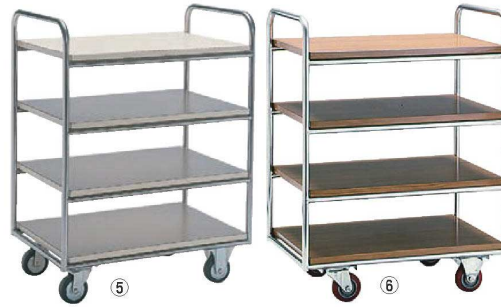
レストランズワゴン 74

ページコード 商品コード 価格 6-2240-0401 4594000 ¥187,000 外寸:750×510×H965 キャスター:φ100(自在×2 固定×2) 材質:フレーム/ステンレス 棚板/メラミン化粧板アコラ張り 棚間隔:上段192 中段193 下段193 ※耐荷重:45kg