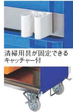
清掃用具が固定できるキャッチャー付