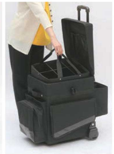
取り外し可能なリムーバルキャディ付