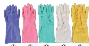
⑨ ⑩ ⑪ ⑫ ⑬ ビニール厚手手袋 ソフトエース 切

材質:表/天然ゴム、裏/ナイロン100% ●極細18ゲージ編手が柔らかく手にフィットします。 ●表面特殊処理加工によりグリップ性に優れています。