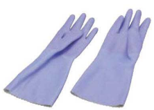
⑧ ダンロップ 手袋 デジハンド ソフトバイオレット

材質:ニトリルゴム ●化学的に強化した表面処理とエンボス状のすべり止め ●No.275のみ裏植毛付