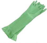
⑥ シンガー 天然ゴム厚手手袋 スーパーロング 切

材質:ニトリルゴム ●油・洗剤等に強い ●やわらかく使いやすい裏毛付 ●ラテックスアレルギーの元となるタンパク質を含んでいません。