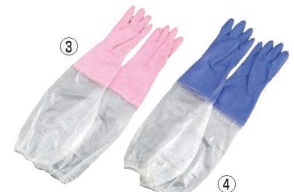
シルキー 厚手手袋 腕カバー付

材質:塩化ビニール樹脂 ●抗菌防臭加工付き、手袋の表面に強力なすべり止め特殊加工が施されています。