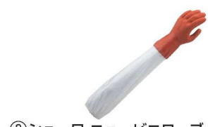
② ショーワ ニュービニール手袋 腕カバー付 No.645

材質:塩化ビニール。 非フタル酸エステル系可塑剤 ●肩口までのロングタイプで腕全体を保護します。 ●裾部分はスリ隙を防止するゴムバンド付きです。 ●手袋部分は薄手でフィット感に優れ、指先感覚が活かされます。