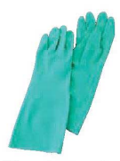
⑦ ニトリル手袋 ソルベックス 切