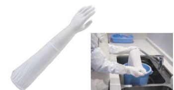
① ショーワ 腕カバー付薄手 No.240 切