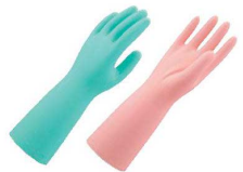
⑤ ショーワ ニトリルゴム製手袋 中厚手 No.139 切