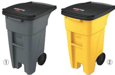
① グレー ② イエロー