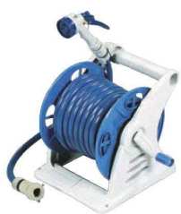
⑤ホースリール ジュニアス20 Gノズル GR20GNF 71

(ホースφ12 15m付) 外形:290×325×H330 ホース耐寒温度/0℃、耐熱温度/60℃ ●水流を用途に合わせて8通りで選べるノズルを使用しています。