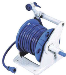
⑥ホースリール ジュニアス30 Gノズル GR30GNF 71