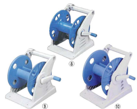
ホースリール (空リール) ジェニアス