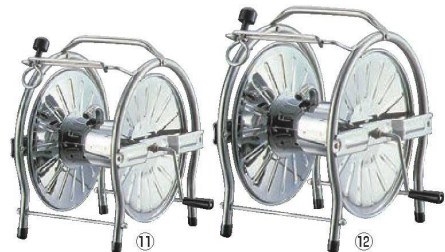
18-0 ホースリール 71

材質:本体/ポリプロピレン ●内径12~15mmのホースに適用 ●使用後にノズルを収納できるホルダー付