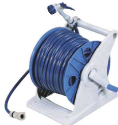
⑦ホースリール ジュニアス50 Gノズル GR50GNF 71