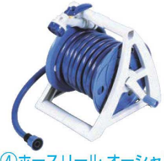
④ホースリール オージャン 15 NPR15GN 71