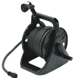
①ホースリール Gアクア205DN 71