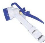
⑬ささめる Gノズル GNC-D8 71