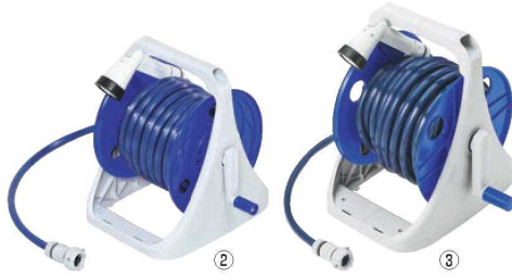
ホースリール Gアクア 71