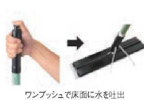
ワンタッチで床面に水を吐出