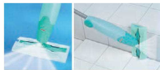
汚れに気づいたときにシュッとスプレーして拭き取りできます。