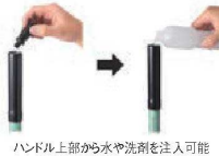
ハンドル上部から水や洗剤を注入可能