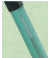
水や洗剤の残量が確認できます。