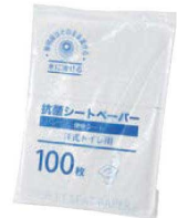
④抗菌シートペーパー (100枚入)