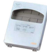
③抗菌シートペーパー 専用キャビネット