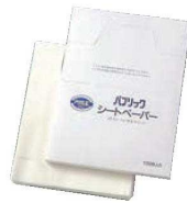
②パブリック シートペーパー 100枚入