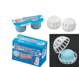
⑮エステー 男子トイレ用消臭尿石防止剤 バイオタブレットケース付