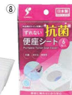
ずれない便座シート