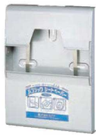
①パブリック シートペーパーディスペンサー