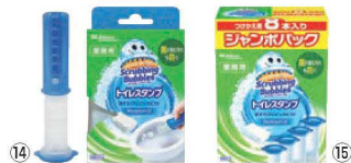
⑭スクラビングバルブ トイレスタンプ フレッシュソープ 本体