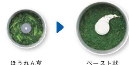
ほうれん草 ペースト状