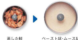
蒸した鮭 ペースト状・ムース状