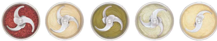
肉類のカッティング クリームチーズの攪拌 各種ルーやスープ類作り ペースト・ソース作り 生地類作り