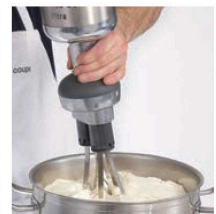
ホイップクリーム