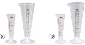
⑨ TPX メートルグラス