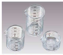
⑥ パティシエール計量カップセット PP-516 3P 71

容量:200cc 外寸:65×65(54×54)×H70 材質:ポリプロピレン ●1合=180ccも計れ、お米の計量にも便利です。