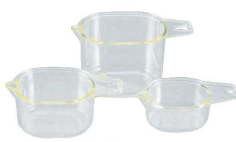
⑦ プラスチック計量カップ 3pcs 71

10cc 30cc 50cc 材質:メタクリル樹脂(耐熱温度80℃) ●3つのカップ(10cc、30cc、50cc)を積み重ねることができ収納に便利です。