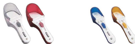
⑰ ラージ/クリスタル 71

外寸:38×46×162 材質:ABS樹脂 ●片手でスライドさせて、計る量を変えられる。 ●マグネット付で、収納ラクラク