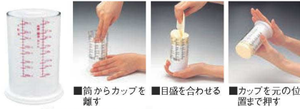
② PE計量カップ エトナ No.1714 71