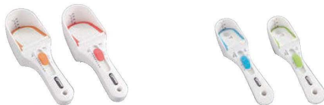
ニュースクープ 容量:ラージ/30~140cc ミニ/5~30cc