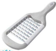
⑥ザクザク ステンレスおにおろし