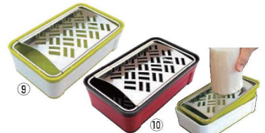
スーパーおろし器