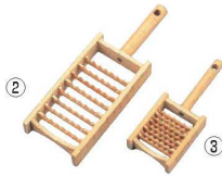
竹 鬼おろし 角型