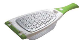
⑰のじ大根スリスリ