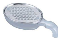
⑳スピードオロシ器 すべらん