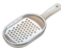
⑱クイーン卸器 ジャンボ