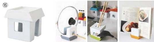
アビュイ マルチスタンド