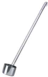
①UK 18-8 和食用 タレレードル