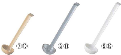
キャンプロ カムウェア レードル LD85