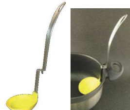
⑬シリコン腰かけお玉