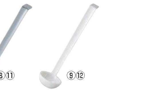
キャンプロ カムウェア レードル LD105