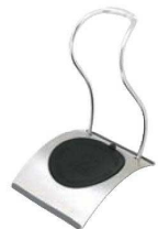
⑭キッチンお玉スタンド