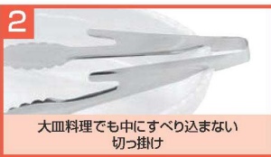
2 大皿料理でも中にすべり込まない切っ掛け