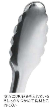
交互に切り込みを入れているからしっかりつかめて食材もこぼれにくい