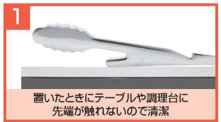
1 置いたときにテーブルや調理台に先端が触れないので清潔