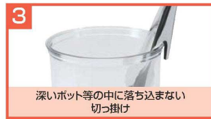
3 深いポット等の中に落ち込まない切っ掛け