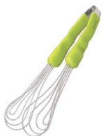
⑱ののじ バクハグパスタング