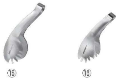
18-8 トング (サテン仕上)