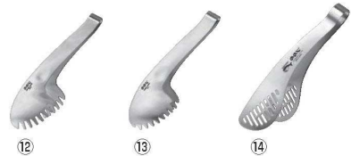
18-8 トング (サテン仕上)