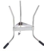
②デバイヤー シノア スタンド