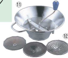
⑪LT 18-10 ムーラン