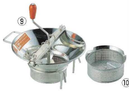
⑨LT スズメッキ ムーラン