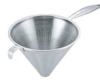
⑥UK 18-8 片手コランダー (モナカハンドル)