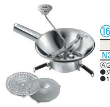
⑯LT 18-10 ムーラン