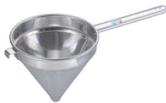
④UK 18-8 スープ漉