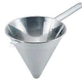
⑤UK 18-8 パンチング スープ漉