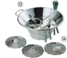
⑬LT スズメッキ ムーラン