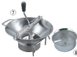
⑦LT 18-10 ムーラン