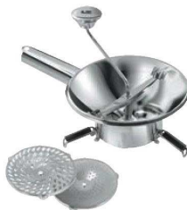
⑮LT 18-10 ムーラン