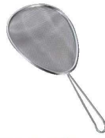
⑧18-8 手付 スクイザル ㊦

材質:網・柄/18-8ステンレス 枠・柄溶接部/NSSC 2120材 ●超強力なワイヤー線材を採用した究極のすくい網 従来のすくい網と比較して強度約2倍 ●2メッシュ