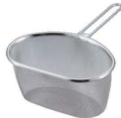
⑩ラスティア 18-8 ハーフストレーナー