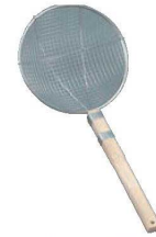
⑥18-8 木柄 丸型 スクイアミ 極荒 ㊦